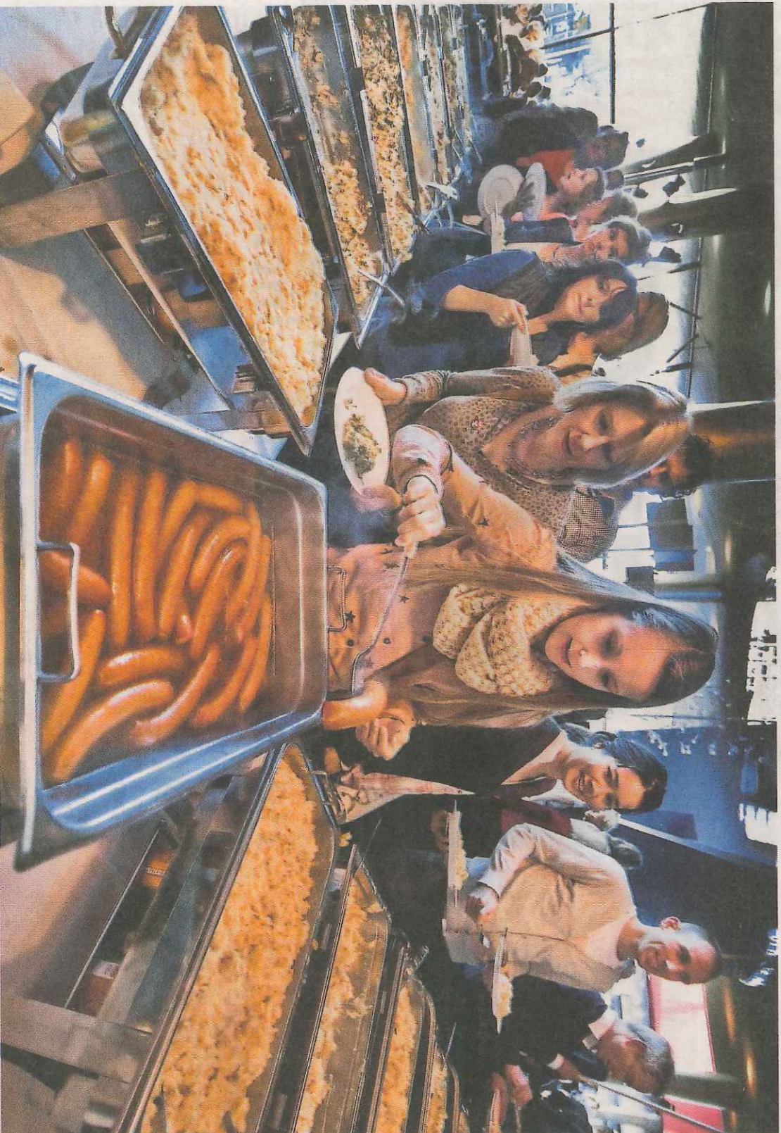
Ruin elftonderd belangstellenden deden zich tegood aan een gratis stampoptocht.

Na 2018, als de plannenmakers voor de culturele hoofdstad gelijk krijgen • hebben 50.000.000 mensen van Leeuwarden gehoord • hebben 10.000.000 mensen meegedacht of -gedaan • hebben 500.000 Friezen het idee dat het ook hun project is • zijn er 3.000.000 bezoekers geweest • komen 2.700.000 bezoekers nog eens terug • kunnen 1.000.000 van hen zich voorstellen dat ze in Friesland zouden willen wonen